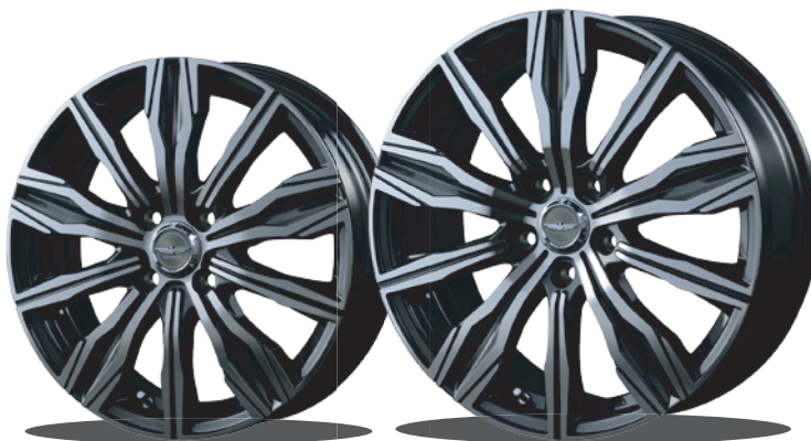
ブラックメタリックミラーカット 16inch